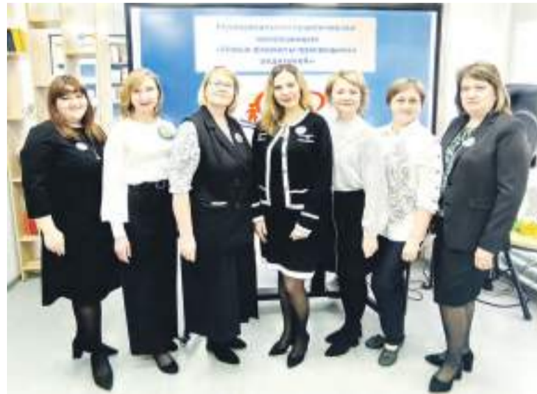
Организаторы мероприятия из детского сада №10 «Гнездышко».

В ходе пленарной части разговор перешел в более серьезное русло. Педагоги и родители вместе обсуждали, как выстроить эффективное взаимодействие между семьей и детским садом. Много внимания уделили тому, насколько важна системная психолого педагогическая поддержка семей и почему так необходимо придерживаться единых подходов к воспитанию и обучению дошкольников. Звучали мысли о том, что пора уходить от привычной модели, когда специалисты просто «доносят информацию», и переходить к настоящему диалогу, где каждая семья