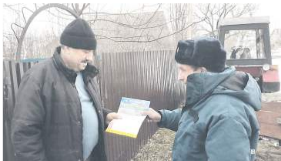
Проводятся подворовые обходы с вручением памяток о действиях в случае подтопления.

- уберите в безопасное место сельскохозяйственный инвентарь, закопайте, укройте удобрения и отходы;