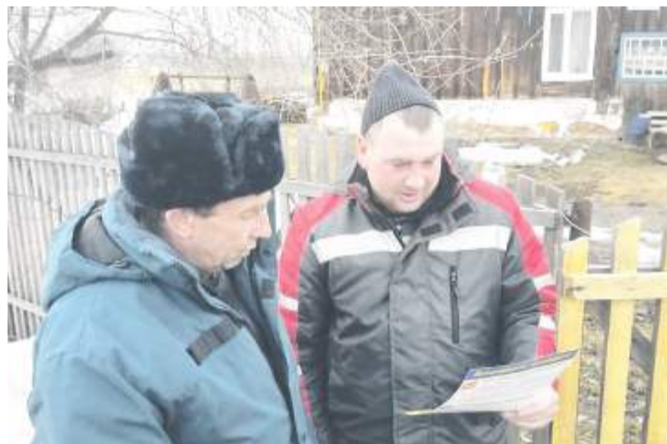
Жителей информируют о сложившейся паводковой обстановке.

При возникновении чрезвычайных ситуаций звоните по телефону «112».