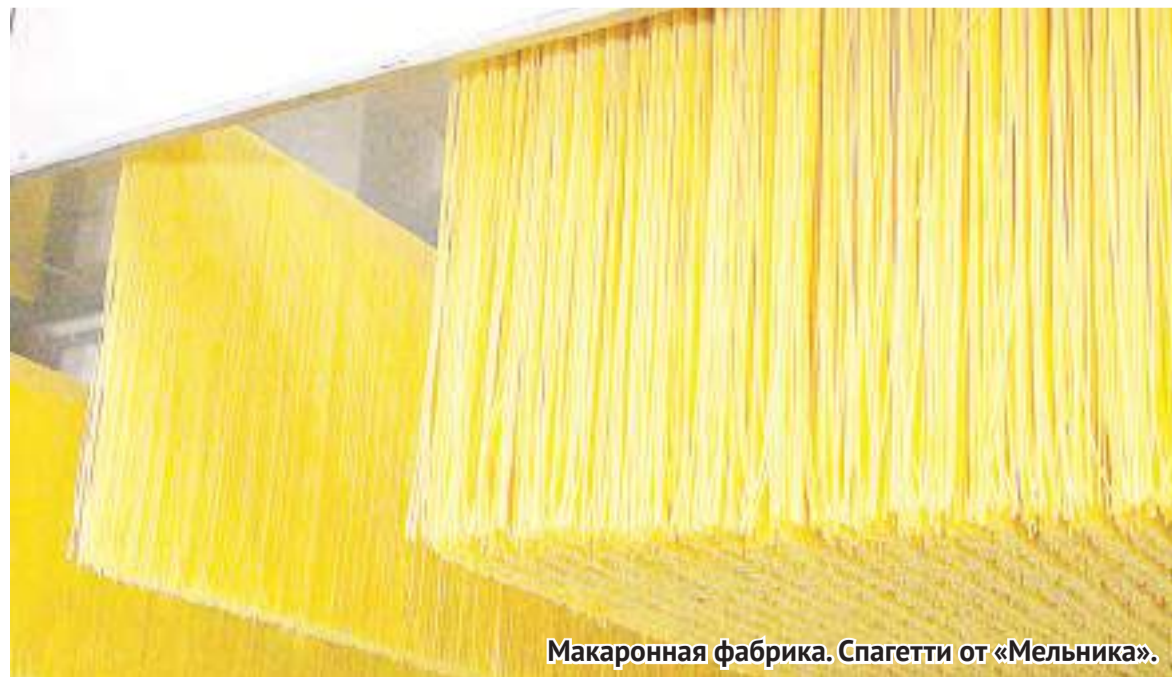
Макаронная фабрика. Спагетти от «Мельника».