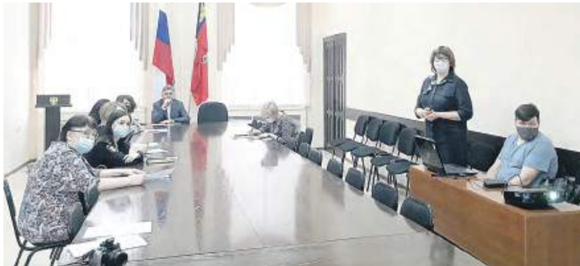
Комиссия слушает доклад об эпидситуации в Рубцовске.

– Вопреки расхожему мнению, со взрослыми работать очень сложно. Многие считают, что эта информация им не нужна, что они сами в состоянии справиться с любой ситуацией. Ещё испытывают страх узнать что-то о себе, подобный диагноз всегда становится ударом и стрессом для пациента. Также есть особенности мышления. Люди старшего по-