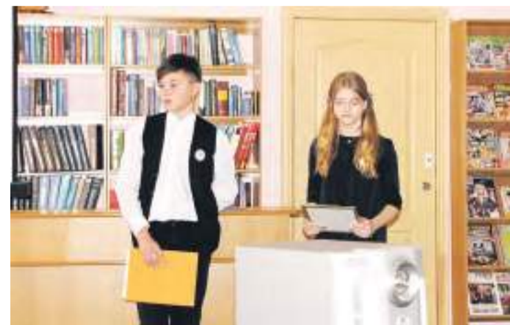
Команда «Знатоки» из школы № 26.