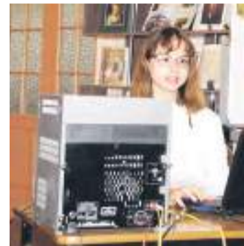
Выступает команда гимназии №3.

дагоги, мероприятие всегда вызывает большой интерес у школьников, которые хотят знать о родном городе как можно больше. Из-за сложной эпидемиологической ситуации и всплеска заболеваний некоторые участники не смогли выступить на презентации своих работ. Однако это не помешало оценить художественный и технический уровень подготовки школьников и оригинальность каждой задумки.