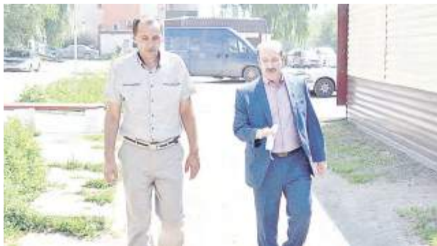
Осмотр проспекта Рубцовского.

Напомним, в 2021 году будут капитально отремонтированы улица Блинского, переулоч Гражданский от проспекта Ленина до улицы Комсомольской, проспект Рубцовский от Комсомольской до Пролетарской и западная сторона улицы Тракторной. Ремонт осуществляется со всей сопутствующей инфраструктурой: тротуарами, бордюрами, пешеходными переходами и примыканиями.