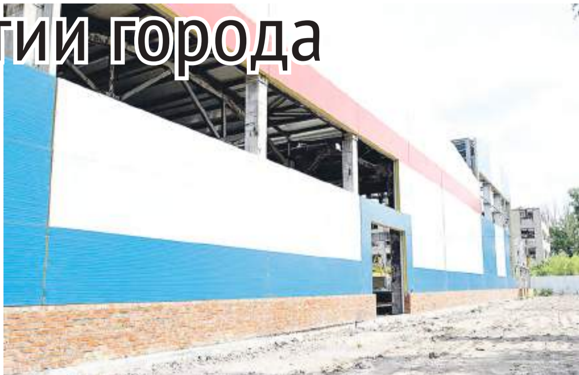
Так будет выглядеть «Юг Алтая» снаружи.

Также нельзя не отметить тот факт, что во многом благодаря этому проекту из краевого бюд-