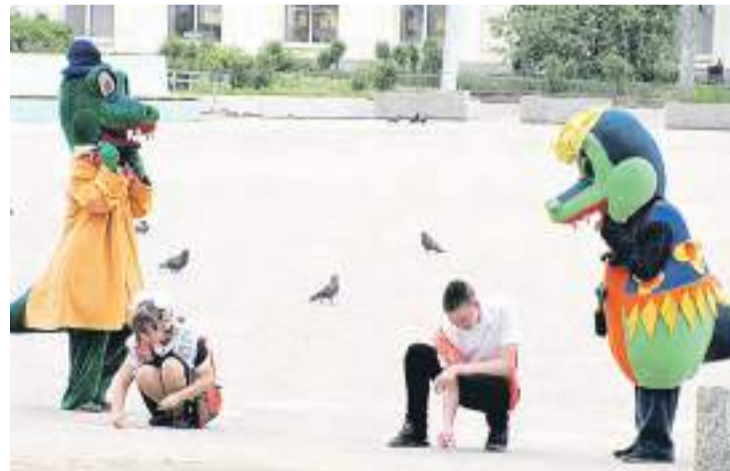
Весёлые крокодилы не давали скучать участникам мероприятий.

Адрес редакции и издателя: 658200, Алтайский край, г. Рубцовск, пер. Гражданский, 33. Выпускающий редактор Селюкова С. М. (4-63-04); отдел рекламы (4-63-64); бухгалтерия (4-64-63).