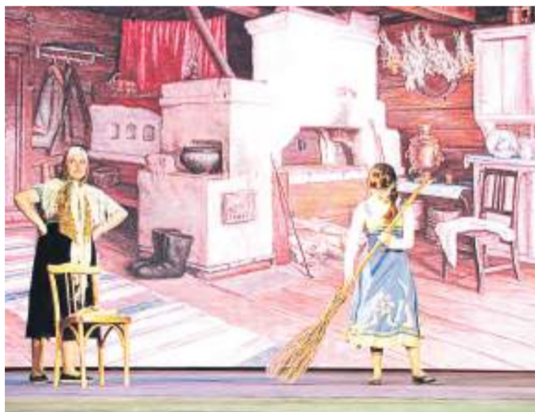
«Морозко» от группы студентов ДО-202.