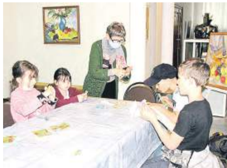
Дети с удовольствием участвовали в мастер-классах.