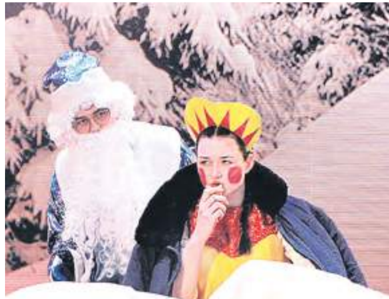
– Тепло ли тебе, девица?

Зрители смогли увидеть любимые сказки детства: «Золушка», «Морозко», «Сказка о царе Салтане». Кроме этого, студенты разыграли сценки и смешные моменты из культовых советских кинофильмов «Служебный роман» и «Любовь и голуби».