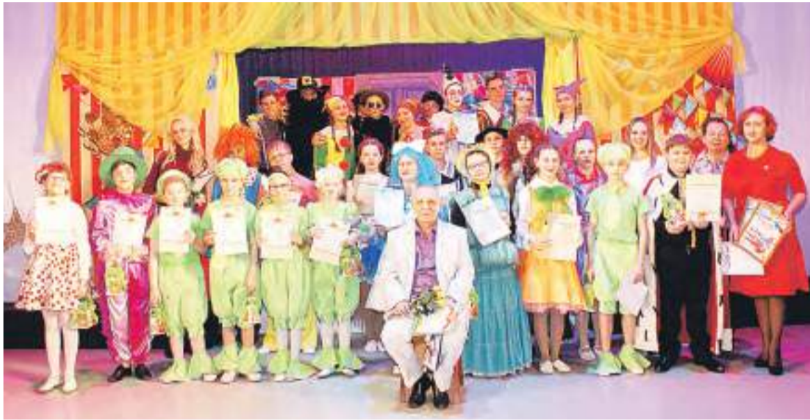
Творческая команда, работающая над спектаклем «Золотой ключик».

Евгения ХВОРОСТИНИНА, фото из архива редакции газеты