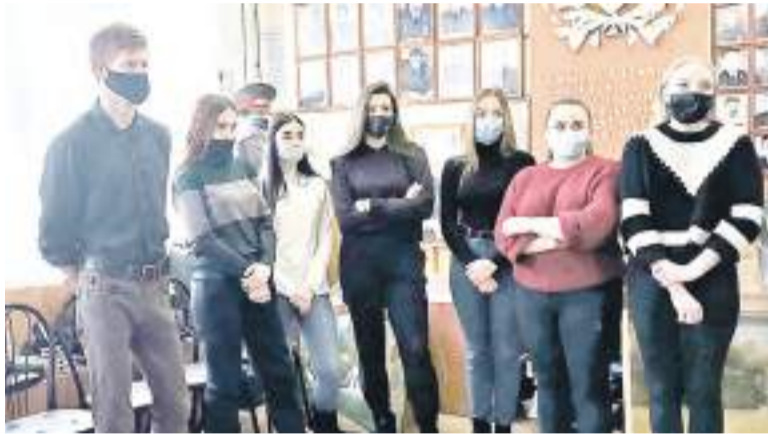
Для студентов сотрудники МВД организовали экскурсию в музей.