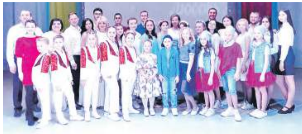
Постоянные участники концерта давно стали большой и дружной семьей.

Евгения ХВОРОСТИНИНА