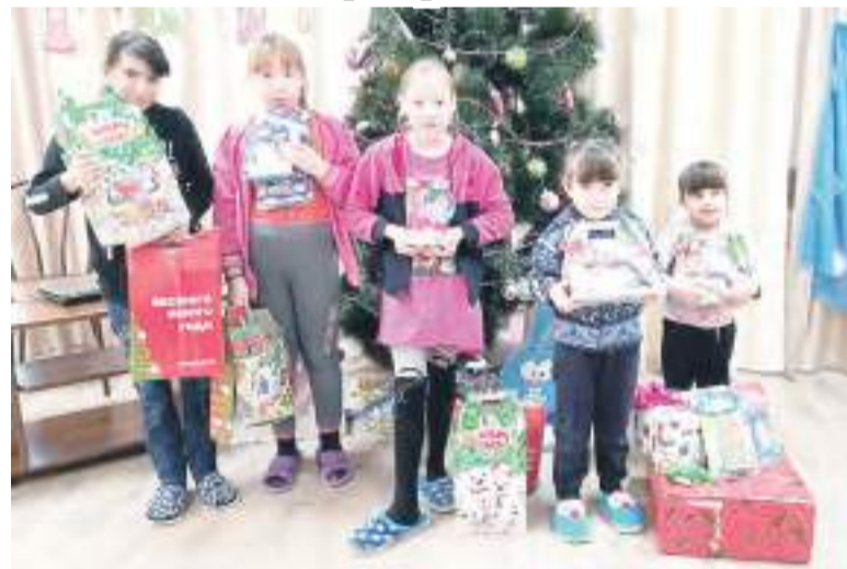
Сюрприз от Деда Мороза дети запомнят надолго.