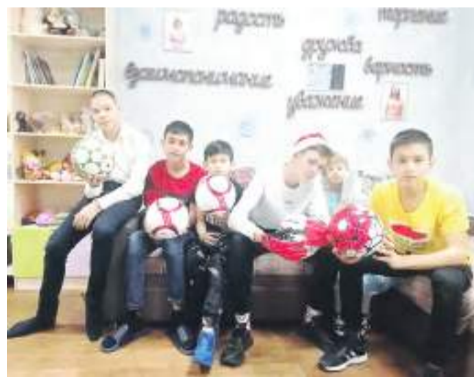
Каждый ребенок получил желанный подарок от Деда Мороза.