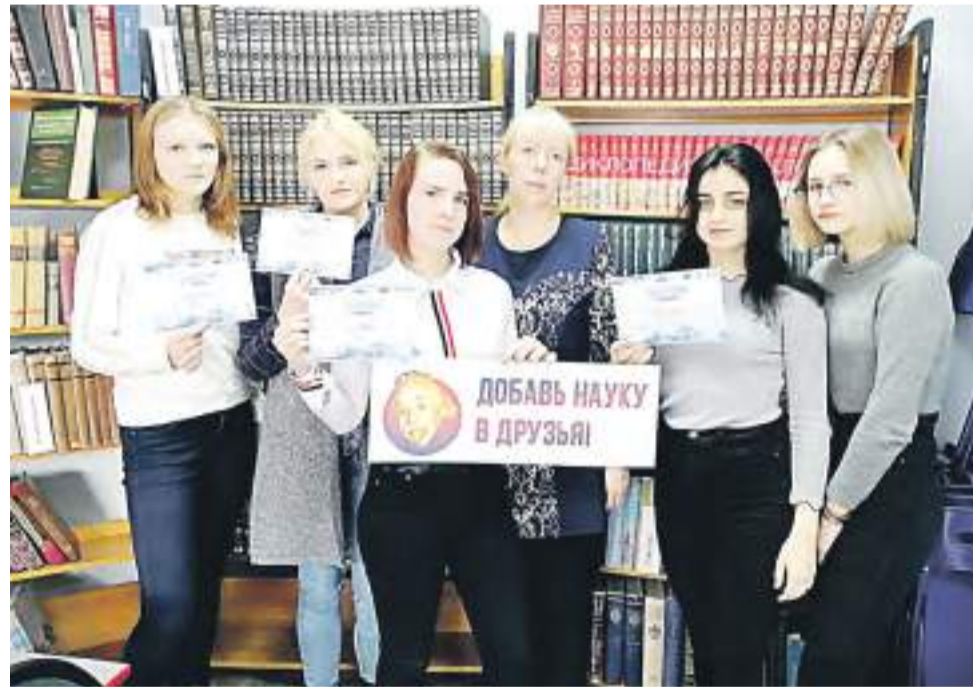
Участники акции «Открытая лабораторная».

После того как участники акции ответили на вопросы, организаторы озвучили правильные ответы. Оказалось, что поло-