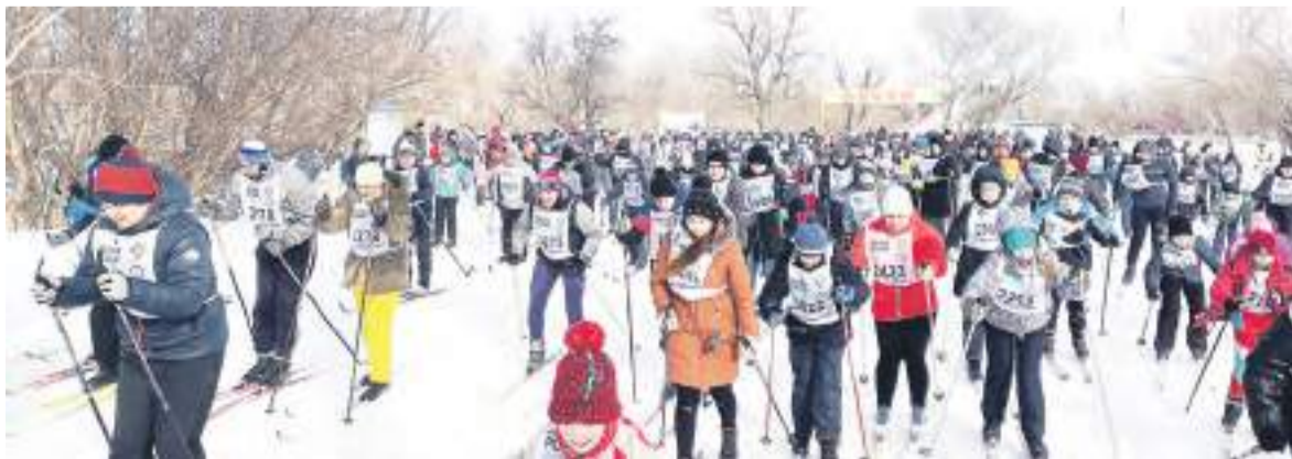
Почти 1000 человек вышли покорять «Лыжню России».