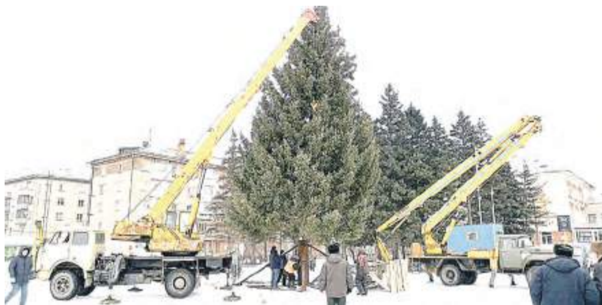
Величавая гостья заняла самое почётное место на главной площади города.