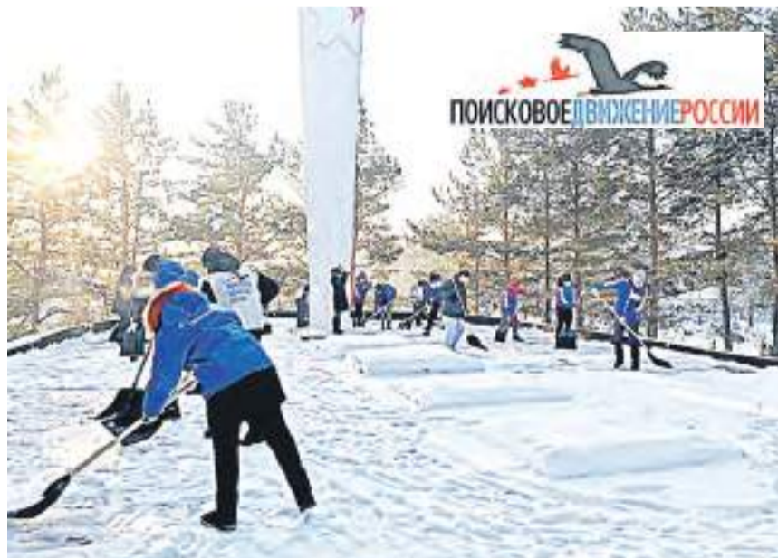
Расчистка снега на воинском кладбище.