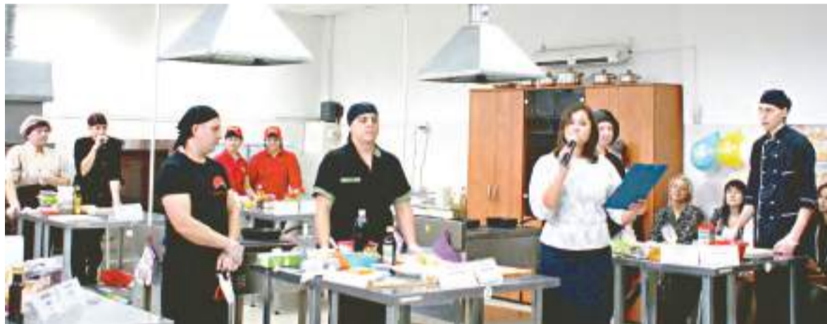
За звание лучших кулинаров боролись представители шести организаций.