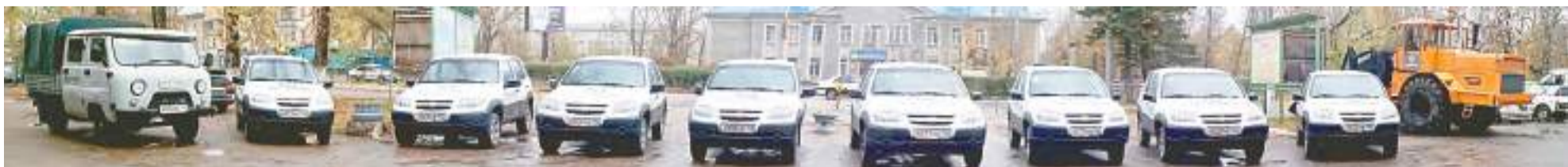
Автотехника для филиалов «Юго-Западного ДСУ».