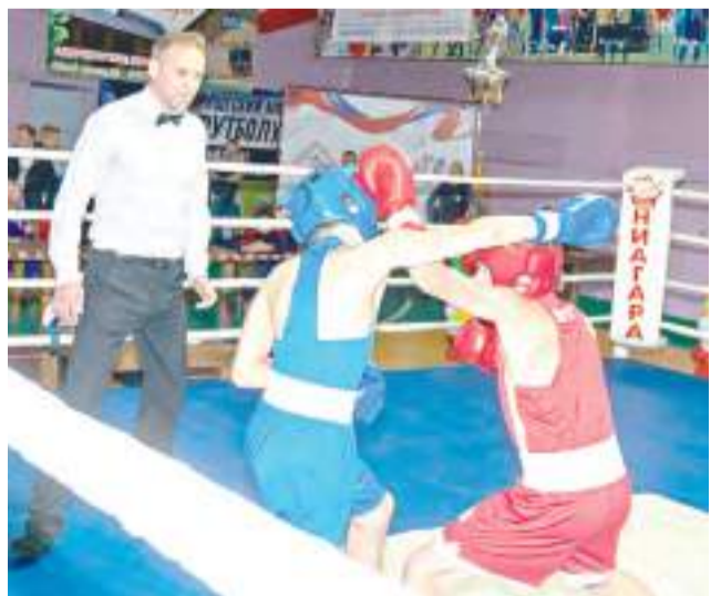
На ринге – сильнейшие.

Соревнования по боксу памяти тренеров и боксёров нашего города проходили 17-19 октября. В этом международном турнире с участием представителей четырёх стран: России (Алтайский край, Новосибирская, Омская, Кемеровская области), Республик Узбекистан, Казахстан и Кыргызстан – за победу боролись юноши 2002 – 2007 годов рождения. О себе заявили более сотни юных боксёров.