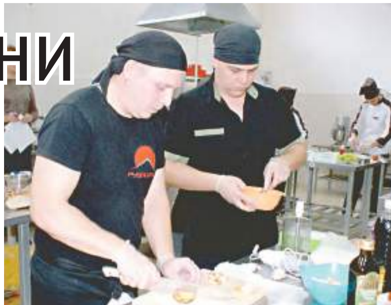
На приготовление блюда участникам выделили всего 10 минут.

Следующим этапом испытаний стала презентация домашнего задания. Участники долго трудились над расшифровкой некоторых старинных кулинарных записей и удивили гостей историческими справками. Конкурсанты раскрыли секретный состав продуктов, из которых можно приготовить настоящий салат «Оливье», каким его придумал известный французский повар в 60-е годы XIX века; рассказали, почему пицца носит имя королевы Италии; объяснили, как сделать омлет так, чтобы