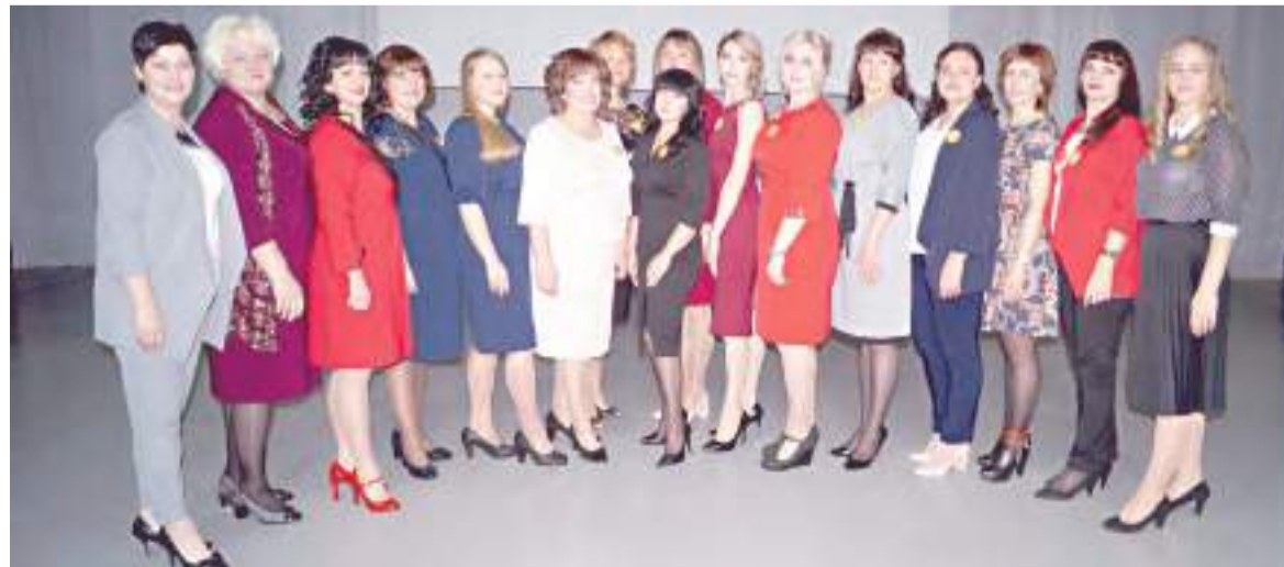
В этом году за звание лучшего педагога поборются 16 конкурсанток.

Уважаемые работники и ветераны автомобильного и городского пассажирского транспорта Рубцовска!