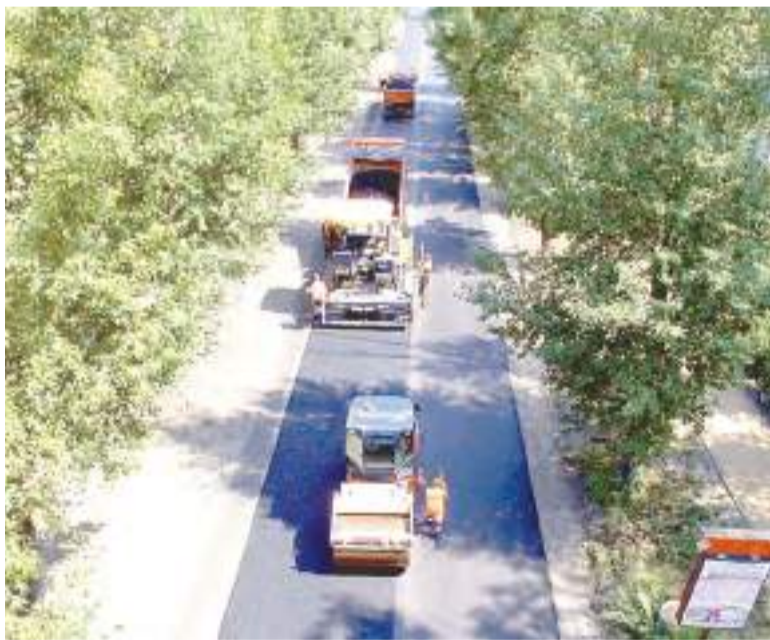
Идет ремонт дорог.