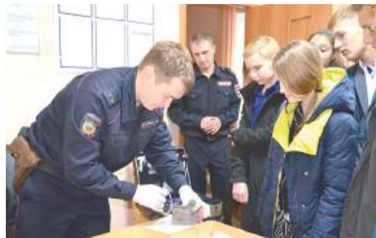
Ребята с интересом наблюдали за работой эксперта.